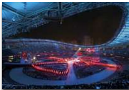
Jeux Mondiaux Athènes 2011